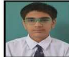
ARYAN ATLAS 96.2