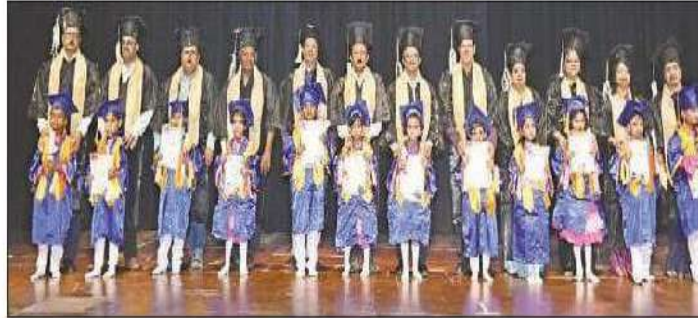
Tiny-tots during the event.

BAL Bharati Public School (BBPS), NTPC Sipat, celebrated its Graduation day-cum-Annual Day ceremony for the pre-primary students recently, centred around the theme 'Potli Baba - Unboxing Dreams'.