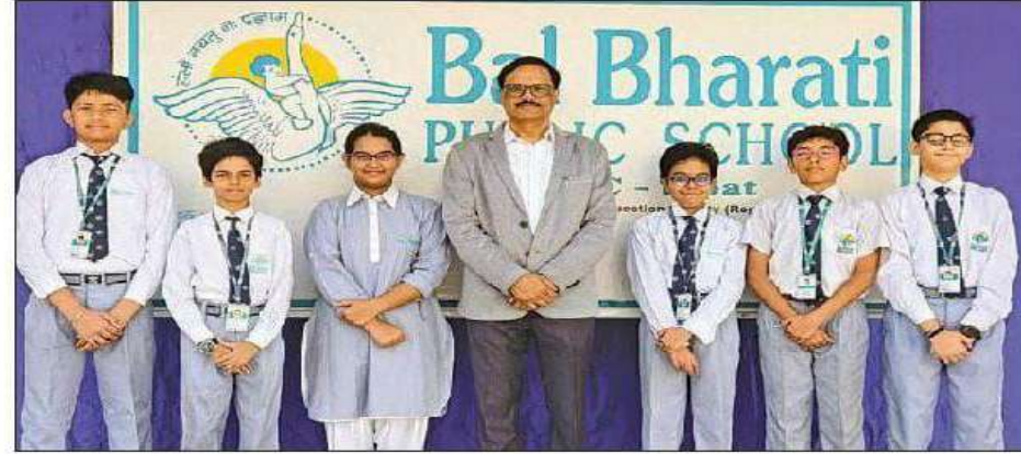
BBPS achievers standing tall.