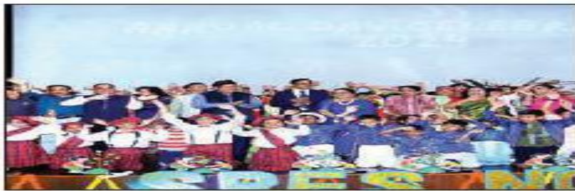
Annual festival at school.